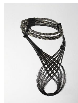
Anaïs Duplan Absolutus Infinitus 2018 Crin de cheval tressé et tissé