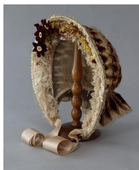
Capote 1850-1853 Velours, paille, crin Musée de la Mode et de la dentelle de Bruxelles