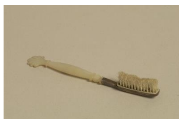
Brosse à dents en crin 1820 Corne, crin

Section 5 : Un matériau inspirant pour la création contemporaine