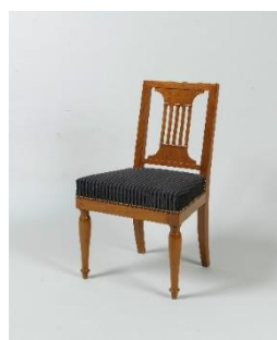
Chaise Début 19 ème siècle Maison Jacob Frères Acajou, crin